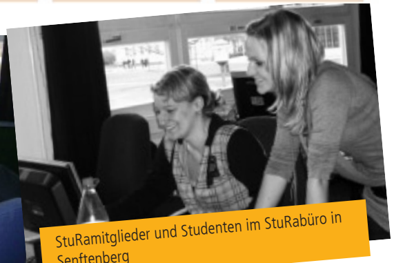
StuRamitglieder und Studenten im StuRabüro in Senftenberg